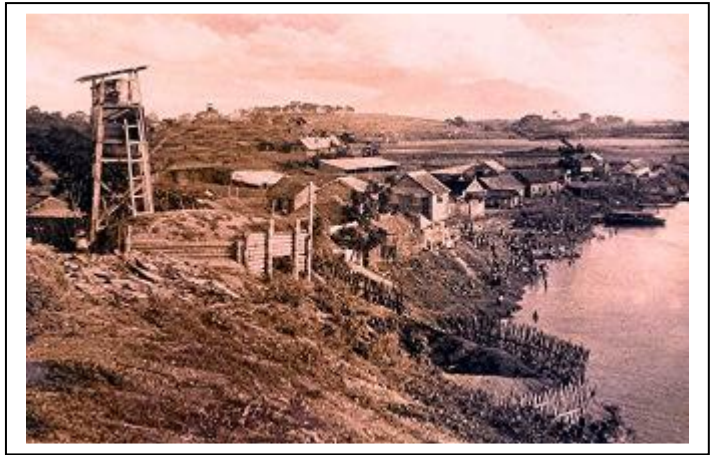
Poste de gué sur la Rivière Noire