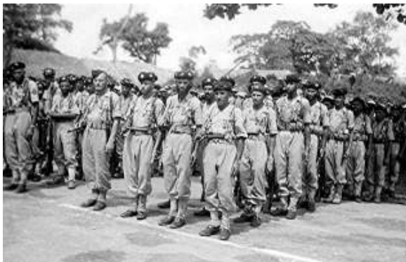
8° TABOR Tonkin