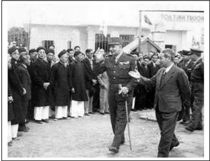
Visite du Gal De Lattre de Tassigny à SonTay.