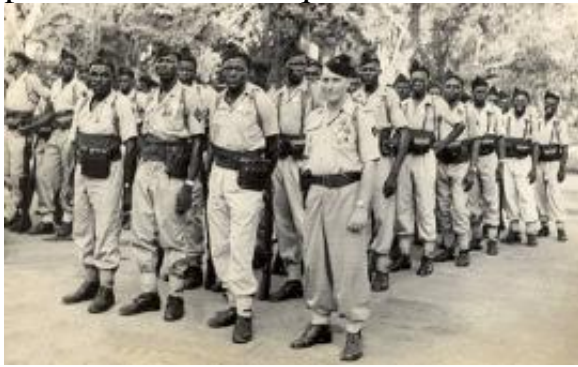
24° RMTS à SonTay